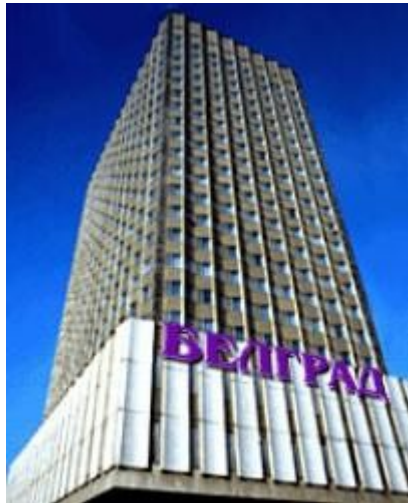
Фотографије гостинице Белград